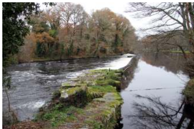
Caneiro de Santa Sabela (Outeiro de Rei)