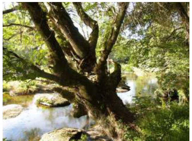
Un dos carballos senlleiros que se atopan na beira do Miño.