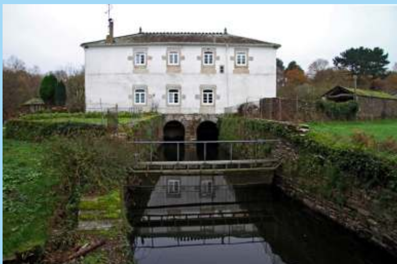
Muíño de Santa Sabela (Outeiro de Rei)