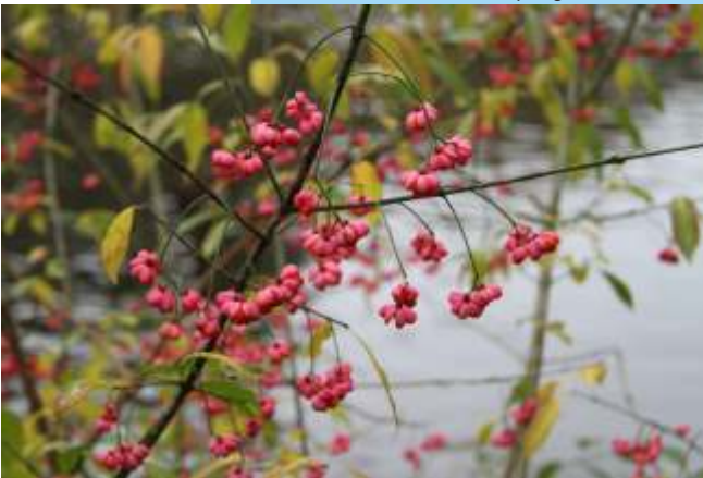
Froitos de evónimo ( Euonymus europaeus ).