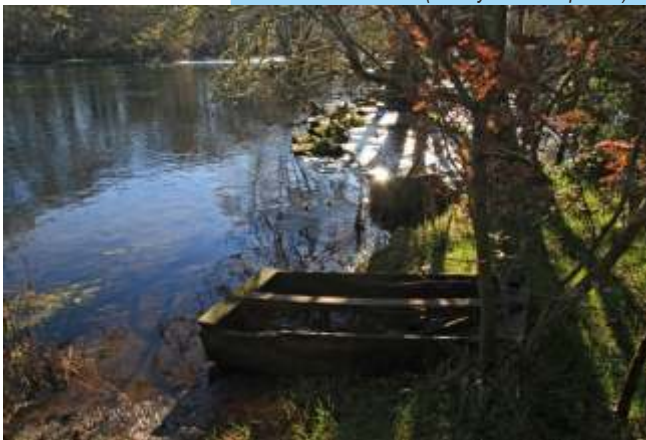
Barca tradicional do Miño.