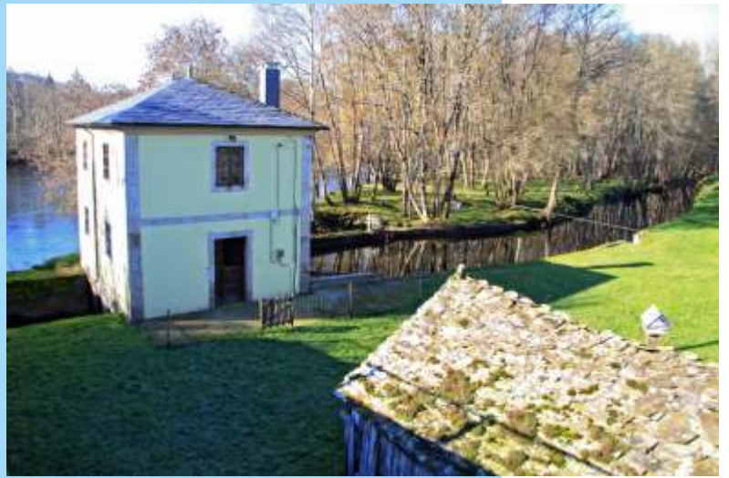
Muíño de Ombreiro