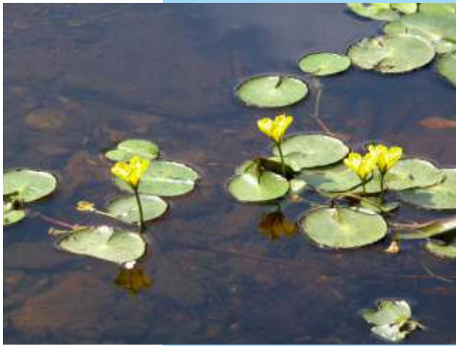
Ambroíños enanos ( Nymphoides peltata ). Planta pouco común que se pode atopar nalgúns puntos do Miño. En Galiza está en perigo de extinción.