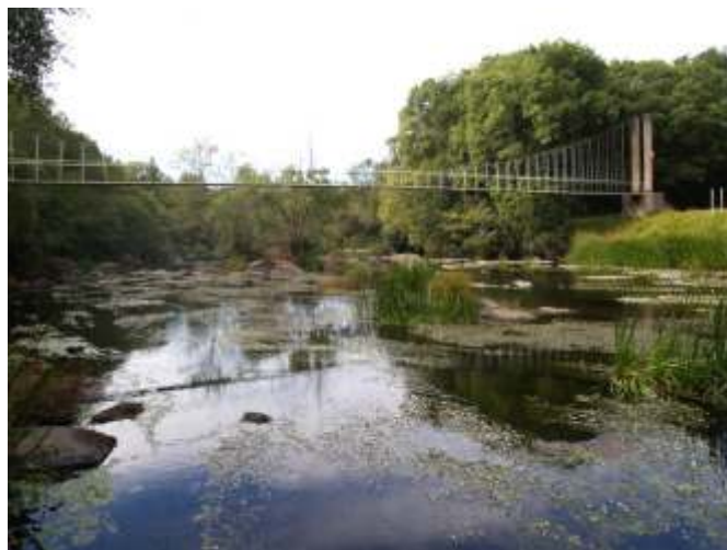
Ponte colgante pola que se accede á Ínsua de Seivane.

Crúzamos a ponte e un pouquiño máis arriba collemos un desvío á esquerda da estrada para continuar pola beira do río. Pasamos ao pé das Ínsuas de Seivane (na de Arriba, á que se pode acceder pola ponte colgante pódese facer un percorrido por dentro dun fermoso bosque); máis adiante rodeamos un pequeno tramo do río Narlae continuamos pola beira da estrada ata chegar á ponte de Ombreiro, co que teremos feita metade da ruta. Despois de cruzar a ponte seguimos un pouco pola estrada e collemos o primeiro camiño á esquerda, pasamos por dentro do peche das cabras, deixando as cancelas aseguradas, e volvemos sen dificultade ningunha, remontando o curso pola outra beira á ponte entre Robra e Martul desde onde, polo mesmo camiño da ida, fixemos a volta á carballeira. Ao ir ou ao volver non podemos deixar de facer o desvío (uns 500 m ida e volta) ao caneiro do Piago, que encora a auga para facer funcionar a minicentral eléctrica que está instalada ali mesmo. Á metade do traxecto de volta pasamos pola beira do recinto do Parque Zoológico de Marcelle.