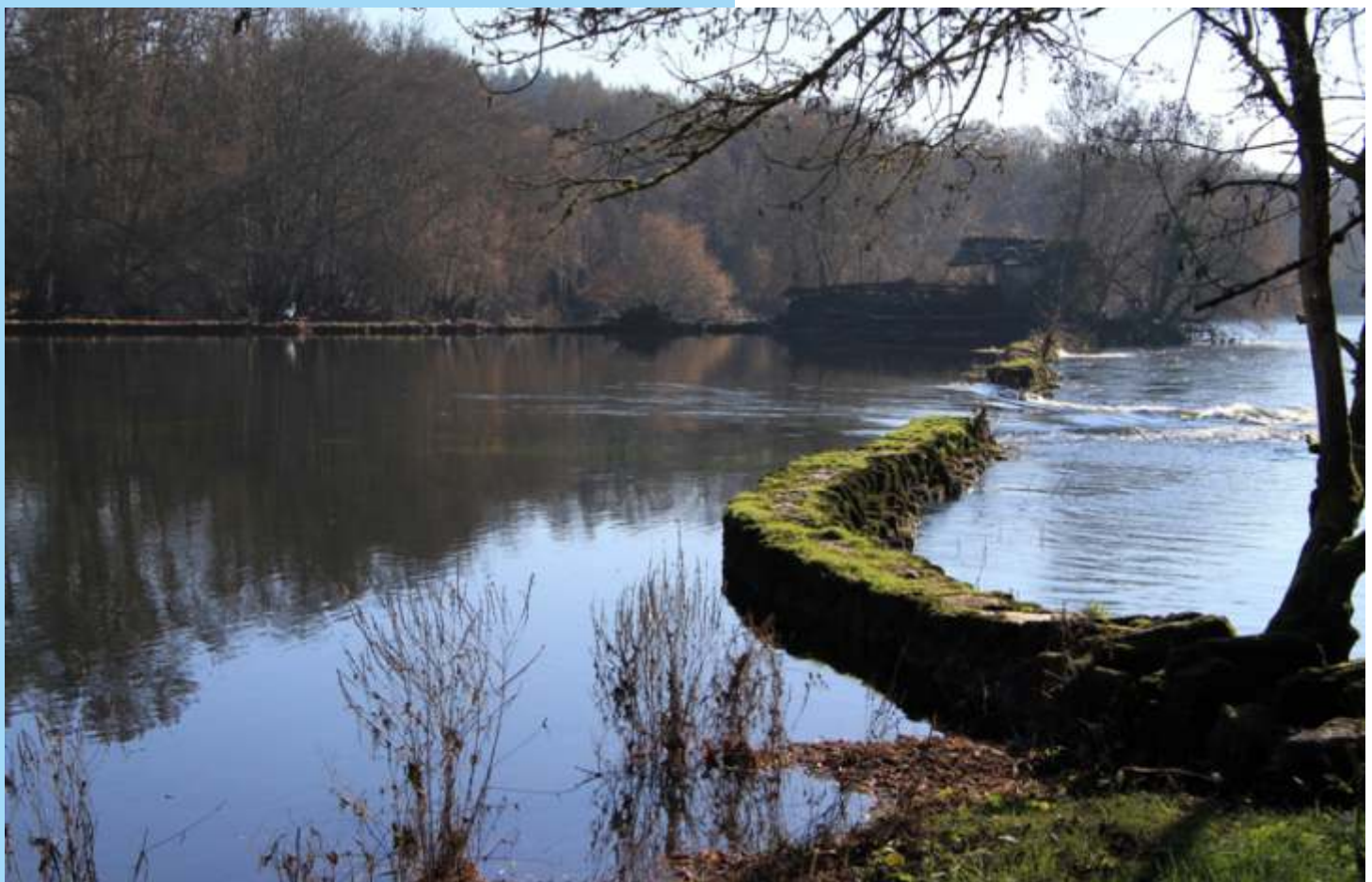
Caneiro para a pesca en Gondai. Conserva no medio do río o caseto no que se refuxiaban os pescadores, almacenaban os aparellos e conservaban a pesca.